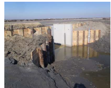
Réparation de l'ouvrage Buget été

Les travaux prévus au programme Life ont débuté en janvier. D'ici le mois de mars, six porte-martelières seront réparées par le service production du salin.