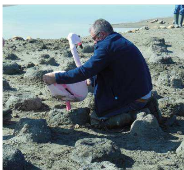
Mise en place de l'appelant sur l'îlot

Toutes ces actions ont pour objectif d'attirer les flamants vers un site de reproduction favorable. Dès la mise en eau du salin au printemps, les sauniers seront très attentifs à l'installation des oiseaux sur l'îlot.