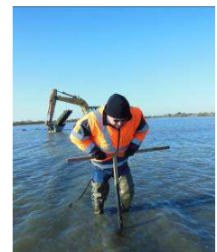
Test de la portance du sol de l'étang de Mansoulène