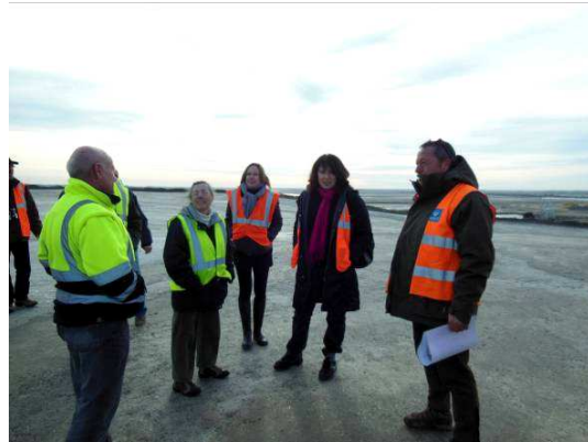
Le responsable saunier explique la récolte du sel

Le 29 janvier, un groupe de 20 personnes a eu la chance de découvrir la production de sel et l'importance écologique du marais salant avec les spécialistes des Salins du Midi. Cette sortie a été l'occasion de rappeler que les zones humides comme le salin de giraud sont une bénédiction pour la biodiversité. Elles représentent la deuxième richesse biologique mondiale après la forêt tropicale. La moitié des oiseaux dans le monde en dépendent.