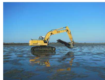
Une pelle mécanique a été utilisée pour façonner l'îlot