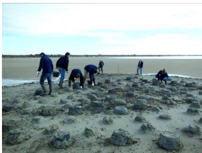
Rénovation des nids artificiels

Un îlot de nidification créé en 2010 pour accueillir les flamants est une nouvelle fois aménagé en 2013. Sur les conseils scientifiques de la Tour du Valat, un morceau de digue situé à proximité de l'îlot a été enlevé afin de mieux isoler le site vis-à-vis des prédateurs. Par ailleurs, le 11 mars, une équipe motivée de la Compagnie des Salins du midi a restauré 150 nids artificiels sur l'îlot d'une surface de 500m 2 . Un saunier a également fabriqué et mis en place 4 appelants en forme de flamants.