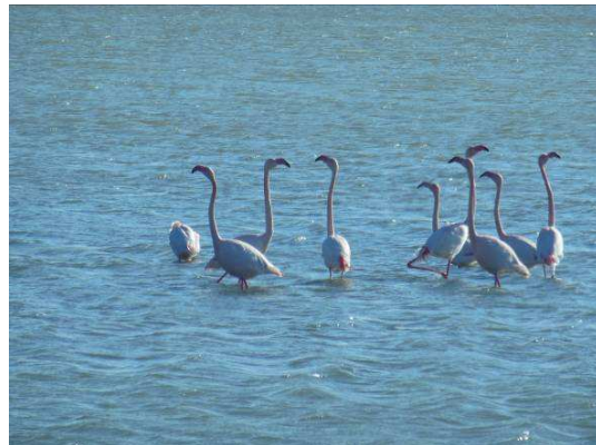
Flamants roses en parade nuptiale

Avec 5 à 10000 flamants observés toute l'année, le Salin de Giraud représente une Zone Humide d'importance Internationale pour cette espèce.