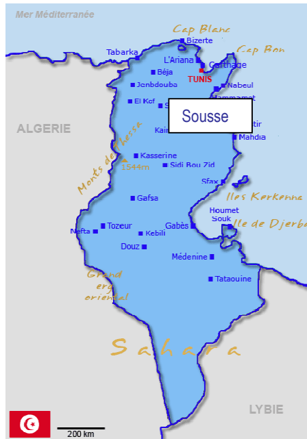
Localisation du salin de Sousse en Tunisie

Pour la première fois en janvier 2013, un recensement des oiseaux hivernants a été réalisé sur le salin de Sousse grâce au partenariat entre Cotusal et l'Université des sciences de Gabès.