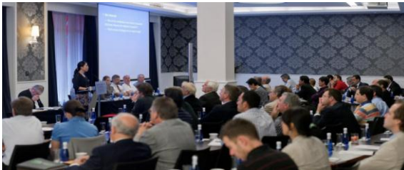
Conférence sur la biodiversité organisée par EuSALT

EuSALT (European Salt Producers' Association) s'intéresse à la biodiversité. Plus de 70 personnes ont assisté aux différentes présentations sur le thème de l'environnement et des salins. L'article "The Salins Group, a SALT Company committed to European biodiversity protection" a été exposé par le Groupe Salins.