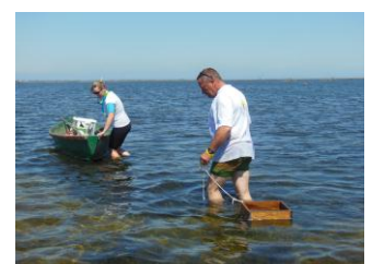
Analyse des plantes aquatiques

Un travail d'analyse a été réalisé pendant cinq mois et a permis d'établir une méthodologie pour évaluer l'impact des travaux de restauration hydraulique sur l'état de santé des lagunes et des oiseaux du salin.