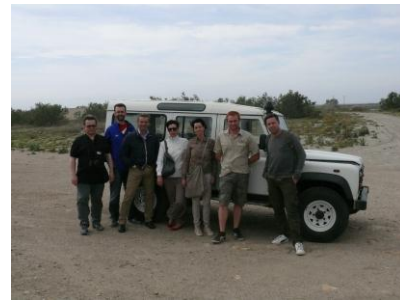
Visite du salin avec le guide naturaliste

Le projet Saltworks correspond à l'inventaire des pratiques touristiques respectueuses de l'environnement en Europe et à la rénovation d'infrastructures sur 4 salins situés en Slovénie (Secovlje et Strunjan) et en Italie (Cervia et Comacchio). Six personnes se sont déplacées sur le salin pour découvrir les activités éco-touristiques du site.