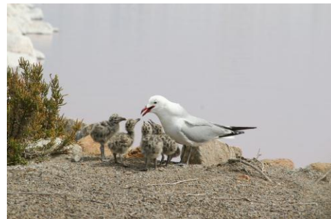
Goélands d'Audouin, site de Torreveija

Les salins représentent des zones d'importance majeure pour la reproduction de neuf espèces de laro-limicoles coloniaux 1 abritant parfois jusqu'à 100 % des effectifs camarguais ou français. Le site de Torreveija accueille actuellement la seconde population espagnole de Goéland d'Audouin. Quant au salin de Sfax, il représente une zone d'importance internationale pour l'Avocette élégante et le site de nidification le plus important d'Afrique du Nord pour le Goéland railleur.