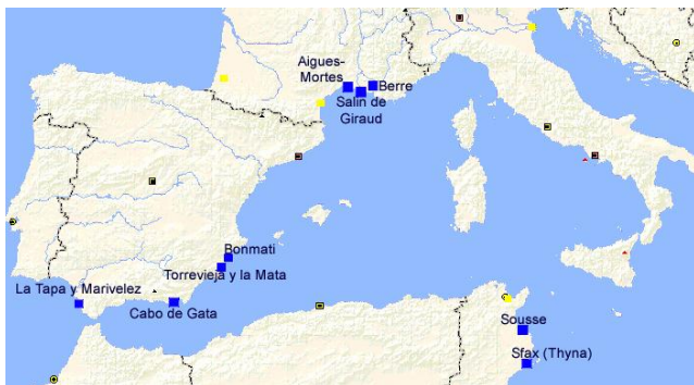
9 sites d'intérêt écologique gérés par le Groupe Salins

Le Groupe Salins a déjà entrepris de nombreuses actions en faveur de la conservation des laro-limicoles coloniaux, populations d'oiseaux aujourd'hui menacées. Il souhaite renforcer la protection de ces espèces par le développement de sites de reproduction, de suivis et d'actions d'amélioration des connaissances de ces populations.