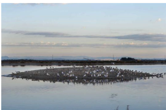
Îlot artificiel accueillant une colonie de laro-limicoles

Les laro-limicoles coloniaux sont des oiseaux marins protégés dont la spécificité est de se reproduire en colonies. Le principal facteur du déclin de leur population est leur faible succès de reproduction : ces oiseaux sont associés à des espaces aux caractéristiques bien précises pour leur reproduction, espaces qui tendent à disparaître avec l'artificialisation du pourtour méditerranéen et le déclin de l'activité salicole.