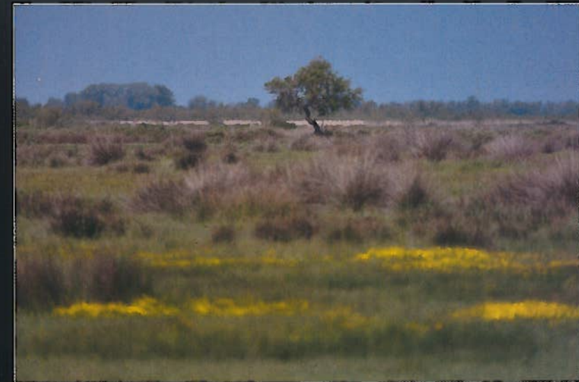
Aux côtés des étangs, des plages, des marais... : les prairies fleuries.