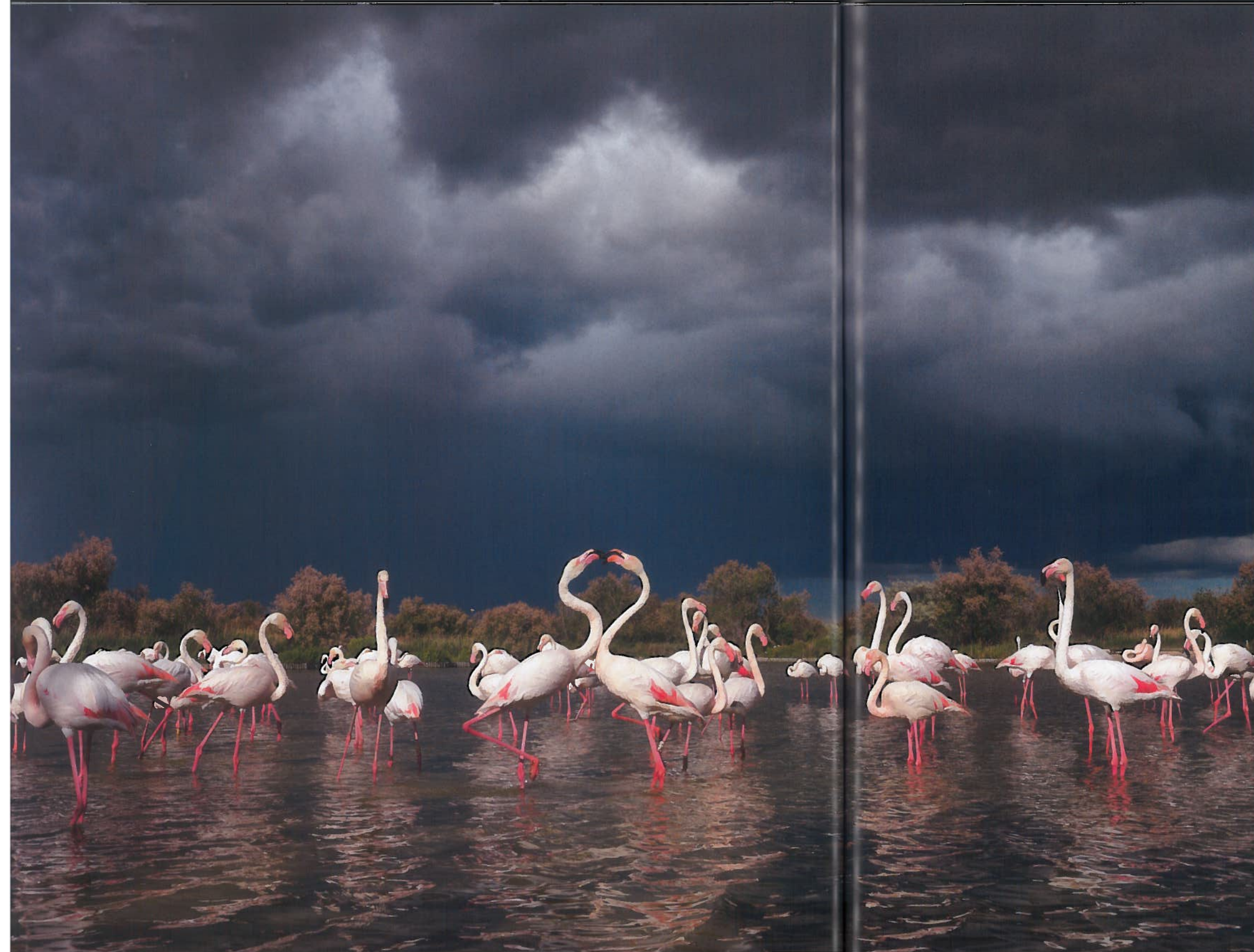
Vaste zone humide située dans le delta du Rhône, la Camargue est un haut lieu de nature, et le site privilégié des flamants roses.