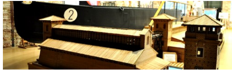
Visita guidata gratuita a MUSA: il museo del sale di Cervia