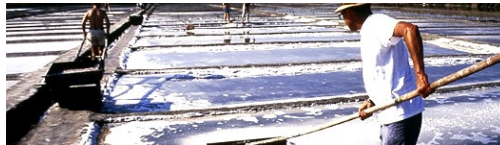
Cervia e il suo sale dolce alle Feste Artusiane di Forlimpopoli