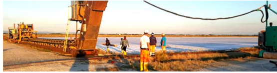
Al via nelle saline di Cervia la "cavadura", la raccolta del Sale Dolce